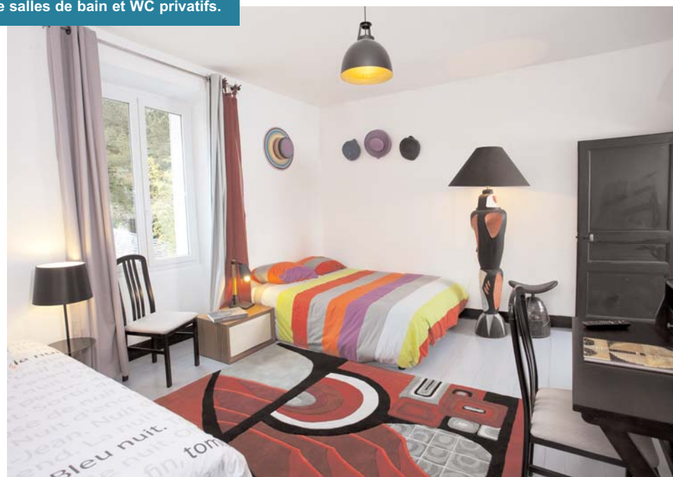
La chambre aux Chapeaux : Une décoration Arts Déco avec les chapeaux de Chéri bibi. Un lit à 2 places et 1 lit à une place. Salle de bain attenante. Terrasse avec vue sur la Vienne.