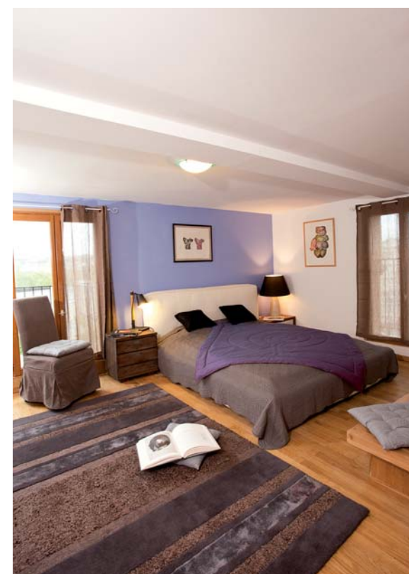
La chambre aux Gravures : avec les œuvres de l'artiste Pierre Digan. Un lit à 2 places et 1 lit pliant pour enfant. Salle de bains. Balcon avec vue sur la Vienne.