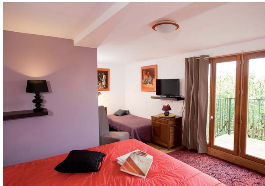
La chambre Marocaine : Avec les tableaux de l'artiste Abderamane Benbachir. Chambre avec salle de bain, 1 lit à 2 places, et un lit à 1 place. Balcon avec vue sur la Vienne.

Les chambres : Pour votre confort, nous mettons à votre disposition dans notre Résidence d'artistes 3 chambres d'hôtes spacieuses toutes équipées de salles de bain et WC privés.